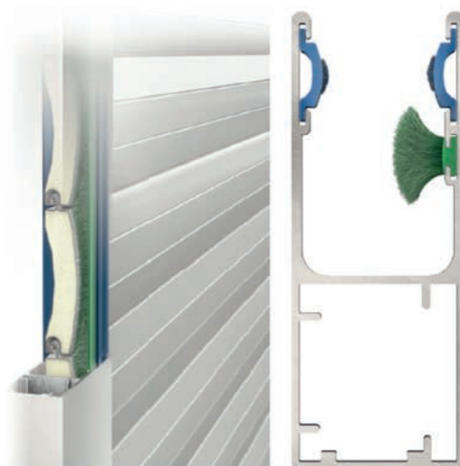
Vue de dessus de la coulisse et de ses joints.